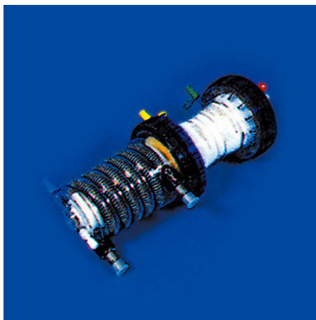
左：中空糸膜の顕微鏡観察 右：世界初の中空糸膜人工肺