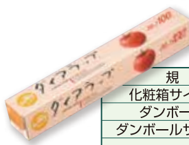
ダイアラップ® handy 30cm×100m