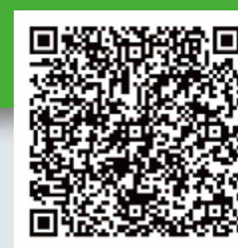
ニチゴー ポリエステル™