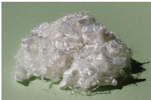
ダイヤブロックSE-1010外観