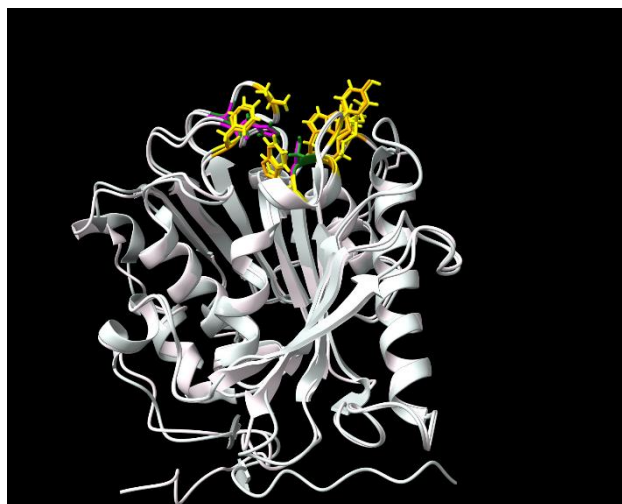
図 2. 既知の PET 分解酵素の結晶構造と本研究で見いだされた PBS 分解酵素の推定構造との比較。 桃色と緑色が活性中心、黄色と橙色が PET 結合部位のアミノ酸を示す。