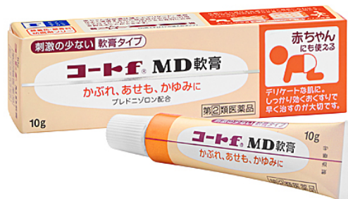
コート f ® MD軟膏 10g