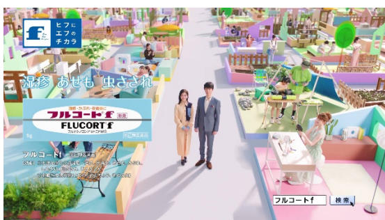
「いつも、そばに。フルコート f。」