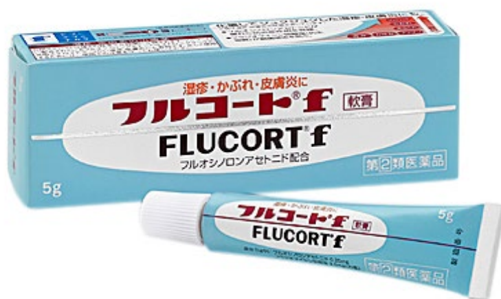
フルコート® f 5g

「フルコート® f」はストロングランクの外用ステロイドである「フルオシノロンアセトニド」を配合。優れた抗炎症作用で「炎症の悪化サイクル」を断ち、赤み、腫れなどの症状を抑え、かき壊しによる悪化を抑えます。また、抗生物質「フラジオマイシン硫酸塩」が患部の細菌増殖を抑え、化膿してジュクジュクした患部にも使用できる軟膏タイプの皮膚治療薬です。