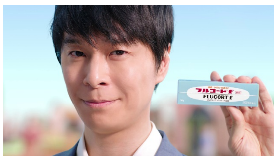
「まずは早めのフルコート f。」