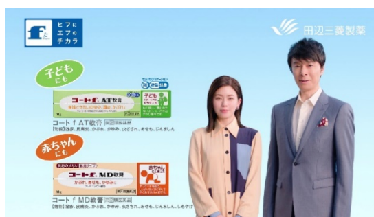
「子ども、赤ちゃんにも。」