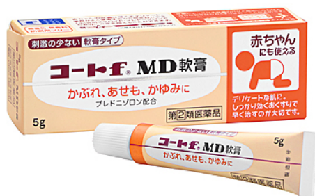
コート f ® MD軟膏 5g

「コート f ® MD軟膏」は、赤ちゃんにも使える効き目の優しい外用ステロイド「プレドニゾロン」を配合しており、しかも防腐剤や着色剤、香料を使っていません。