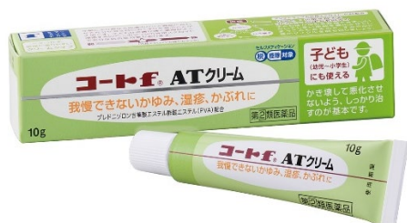
コート f ® A Tクリーム 10g

「コート f ® A T軟膏／クリーム」は、お子さんにも使える効き目が穏やかな外用ステロイド「プレドニゾロン吉草酸エステル酢酸エステル(アンテドラッグ)」やかゆみ止め成分などを配合。