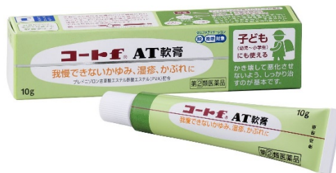
コート f ® A T軟膏 10g