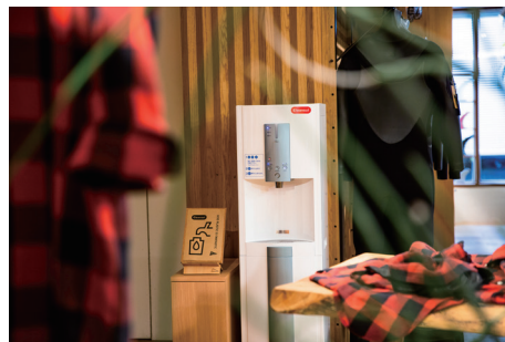
Pilgrim Surf+Supply (無料)