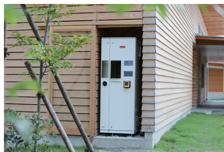
VISION 内ウォーターサーバー