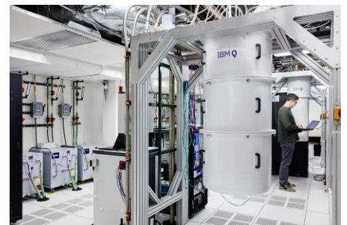
IBM Quantum Computer