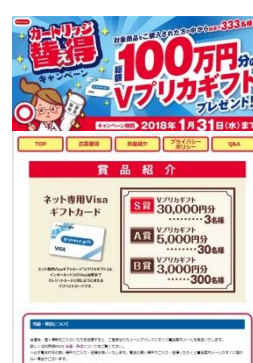
「カートリッジ替え得キャンペーン」 キャンペーンPOP(左)と、キャンペーンシール(中)、キャンペーンサイト(右)