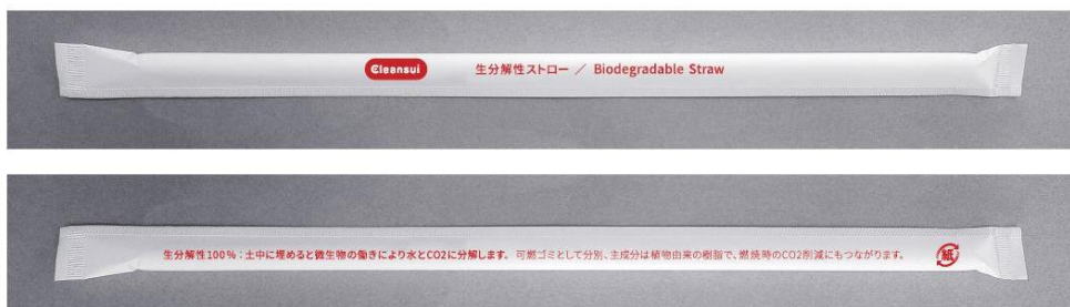
「BioPBS™」ストローイメージ

「MIZUcafé PRODUCED BY Cleansui」にて採用する生分解性ストローは、4月から京急グループ各社が運営する飲食店、百貨店、ホテルなどで採用され、5月からはワシントンホテル(株)や飲食店でも採用されています。