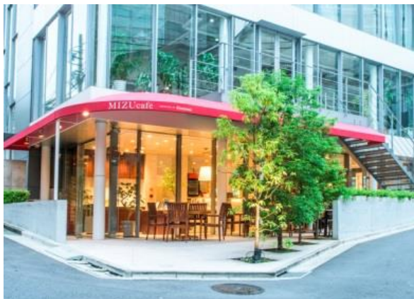
「MIZUcafé PRODUCED BY Cleansui」外観