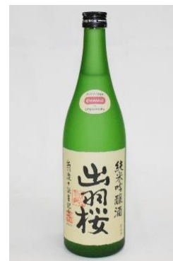
『出羽桜 純米吟醸酒 Cleansui 仕込み(瓶火入)』