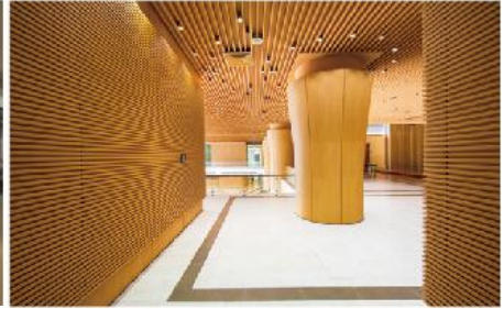
The National Assembly Office of Vietnam