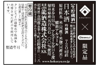
黒龍×Cleansui 吟醸生貯蔵酒 瓶ラベル (表/裏)

商 品 名 : 黒龍×Cleansui 吟醸生貯蔵酒 原 材 料 名 : 米(国産)、米麴(国産米)、醸造アルコール 原 料 米 : 福井県産五百万石100%使用 精 米 歩 合 : 55% アルコール分 : 14.5度 内 容 量 : 720ml 製 造 元 : 黒龍酒造株式会社