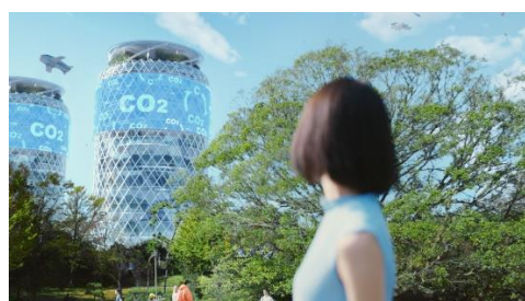
二酸化炭素を資源として活用する社会