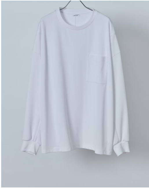
・ロングスリーブTシャツ（ノーマル） 税込価格：19,300円