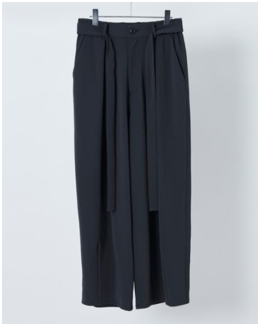
・ワイドパンツ 税込価格：38,500円