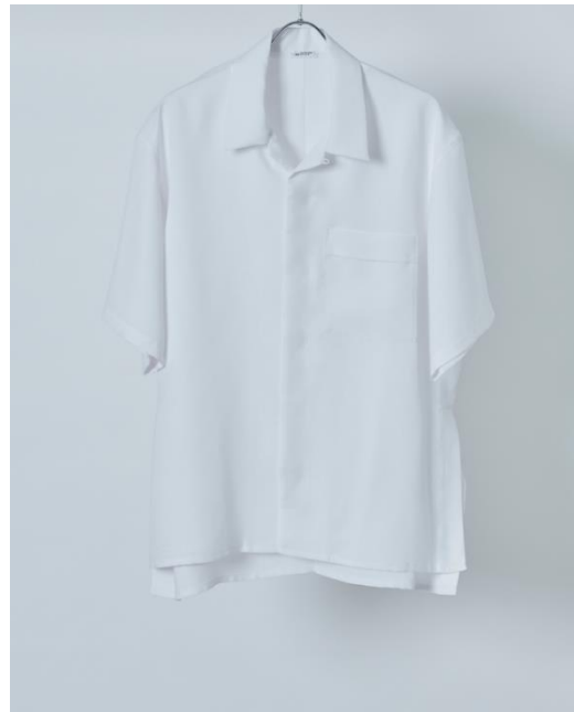
・オープンカラーシャツ 税込価格：28,600円