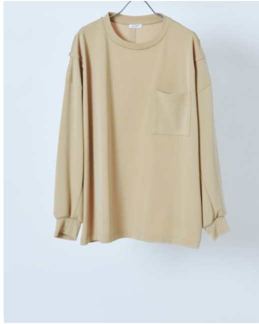
・ロングスリーブTシャツ（肩上げ） 税込価格：19,300円