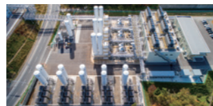
半導体産業に高純度窒素を供給するASU(空気分離装置)