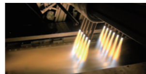
CO 2 排出量削減に貢献する酸素富化バーナー