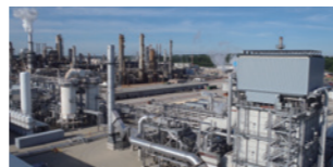
水素を供給するHyCO ® プラント